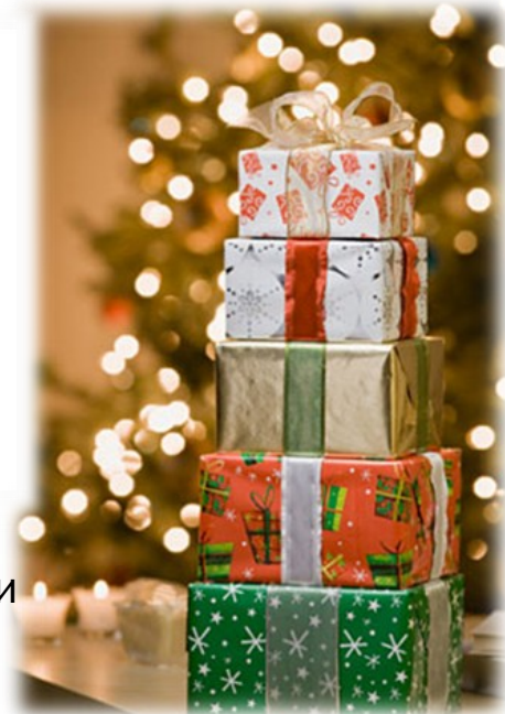
Подарки с символами года