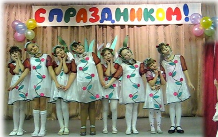
Самая младшая танцевальная группа

А какие танцевальные номера подготовили малыши!