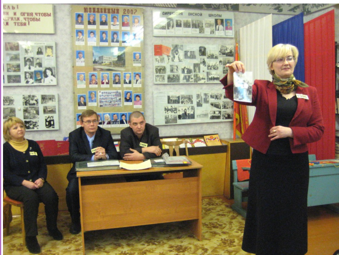
Родители учащихся 9а класса вспоминают свои школьные годы

В декабре нашей замечательной школе исполнится 90 лет! Это много для одной человеческой жизни, а для такого учреждения, как школа, это всего лишь крупица в океане жизни. Ведь школьная жизнь складывается из десятков тысяч человеческих судеб. А сколько их было за 90 лет?!